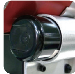
MIT capacitor voltage is more stable