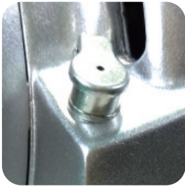
lubrication hole convenient to refill oil