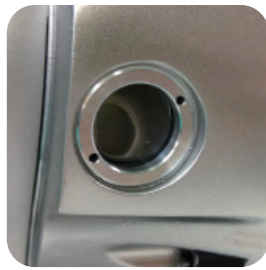
easy to check oil level