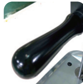
High texture Solid wood carrying handle